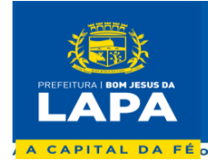
Fabio Nunes Dias Prefeito Municipal

PREFEITURA MUNICIPAL DE BOM JESUS DA LAPA – BA Rua Mal. Floriano Peixoto, nº 208 - Centro. CNPJ: 14.105.183/0001-14 E-mail: licitacao@bomjesusdalapa.ba.gov.br Tel: (77) 3481-4211